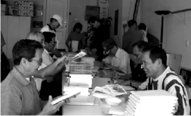
Dán tên và địa chỉ lên phong bì