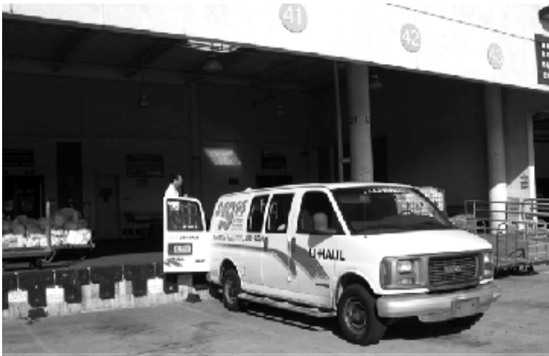
Trực chỉ ra Bưu điện