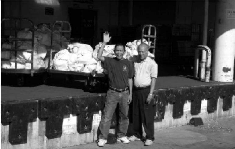
Tất cả đã hoàn tất sẵn sàng chờ cân đo