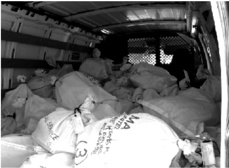
Đa Hiệu đã sẵn sàng từng bao chất đầy trong UHault