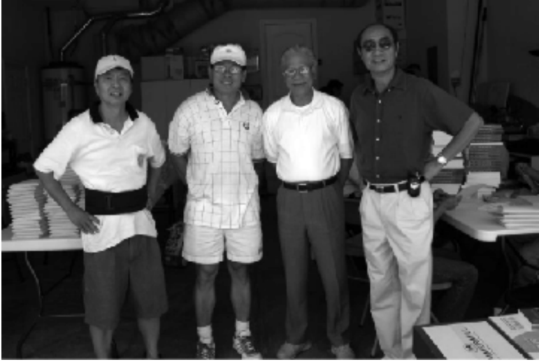
CSVSQ Sang 28, Thắng 25, Nho 19 và Hải 19