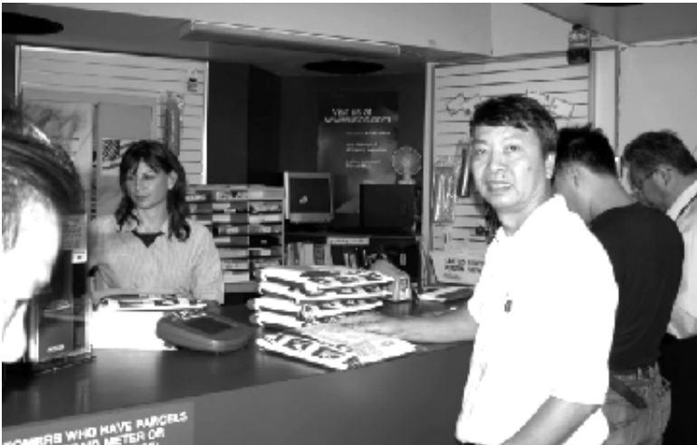
Đa Hiệu sẵn sàng tới tay quý CSVSQ Võ Bị và thân hữu