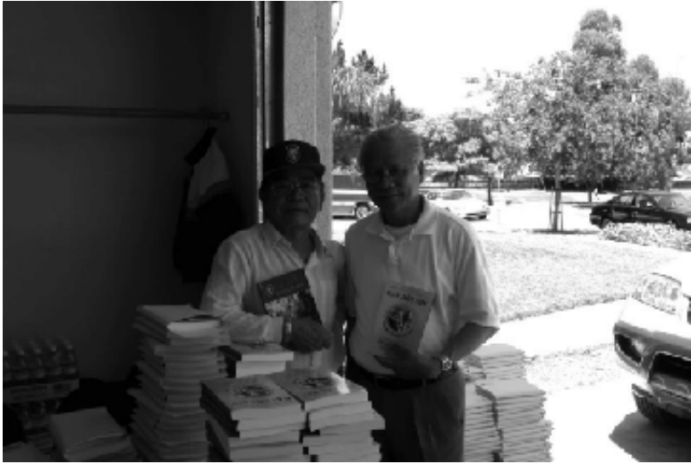
Chủ nhiệm và HT HVV/Bắc Cali chia sẻ tiếp tay