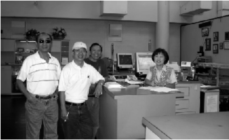
Thanh toán bưu phí xong xuôi ...