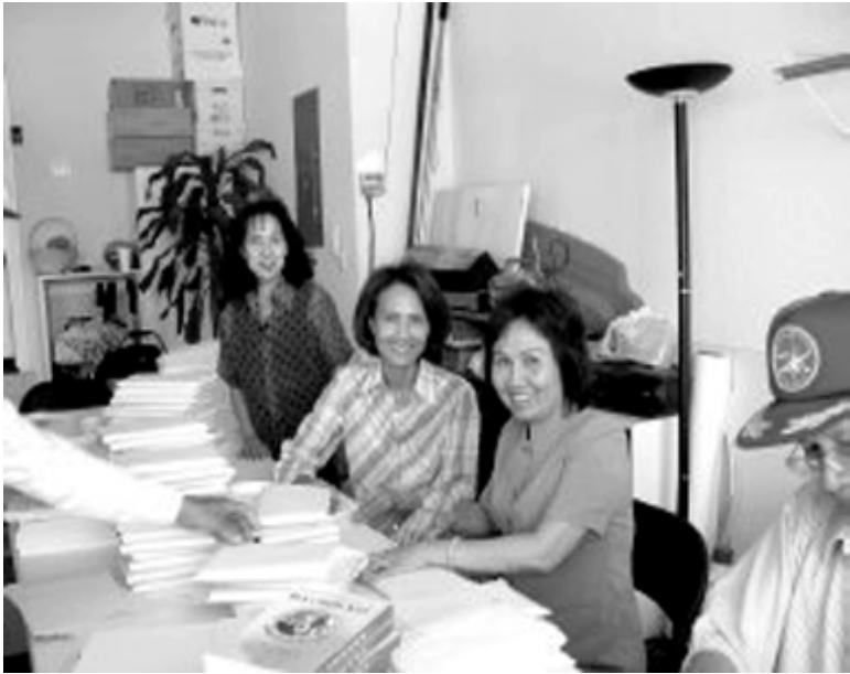
Quý phu nhân tiếp tay tươi cười vui vẻ