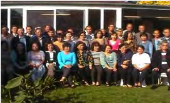
Hình ảnh Sinh hoạt Hội Võ Bị Úc Châu